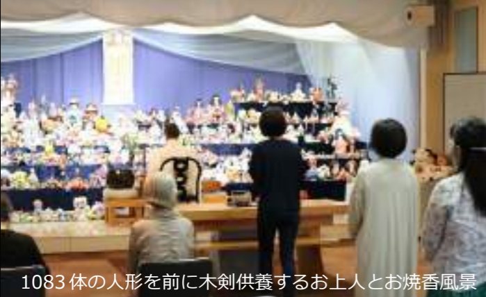
1083体の人形を前に木剣供養するお上人とお焼香風景

5/14 (木)・5/15 (金) 10時～12時 5/16 (土) 9～10時半