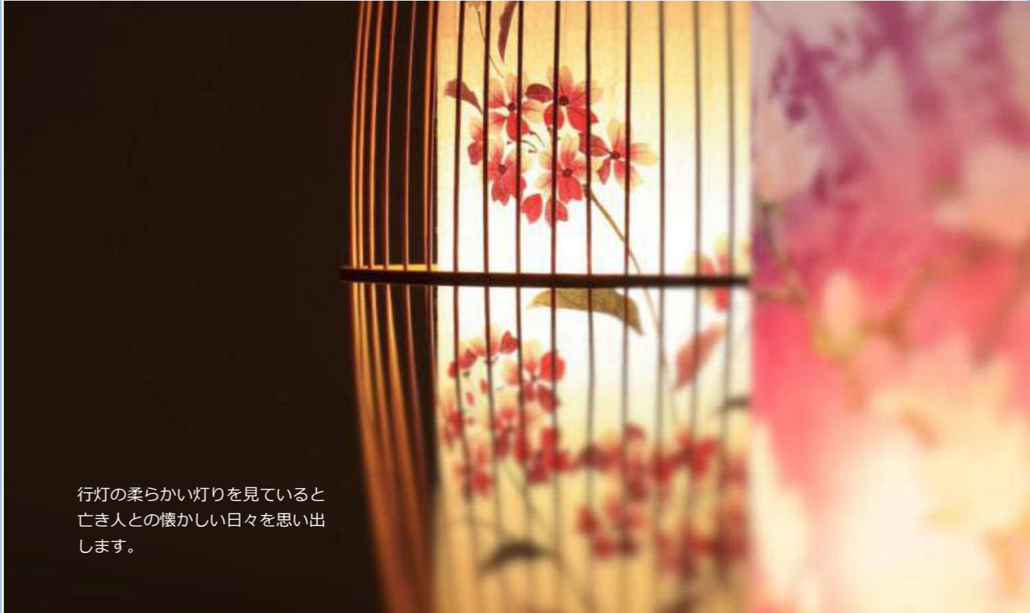
行灯の柔らかい灯りを見ていると亡き人との懐かしい日々を思い出します。

店頭でお盆のご相談をお受けしている「正しいやり方がわからない…」というお声をよく聞きます。迎え火は行わなければならないのか、集合住宅ではどうしたらよいのかと不安に思われる方も少なくありません。迎え火や送り火が難しい場合に、弊社では盆提灯や行灯の灯りをその代わりにしていただくことを提案しています。 忙しい毎日の中では、故人をゆつくり思い出す時間は意外と少ないものです。しかし、お盆があるからこそ少し立ち止まり、思い出を語り、感謝の気持ちを伝えることができます。それは亡き人のためであると同時に、今を生きる私たちの心を整える時間でもあるのかもしれません。 その想いをかたちにするもののひとつである行灯には、素材や絵柄、光のやわらかさにまでこだわったもの、華やかなもの、落ち着いた趣のもの、現代のお住まいに合うすっきりとしたものなど、た