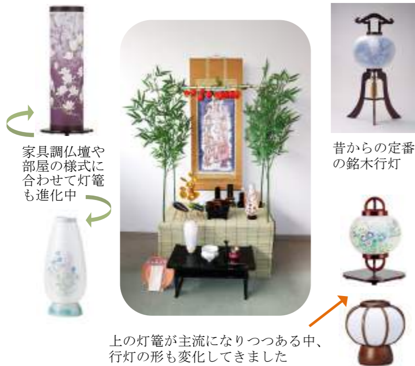
家具調仏壇や部屋の様式に合わせて灯籠も進化中