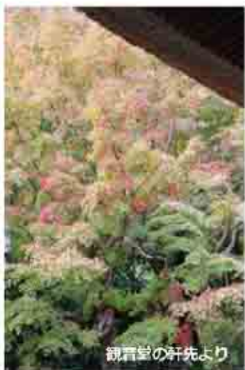
観音堂の軒先より

前置きが長くなったが、今回ご紹介したいのは北鎌倉にある長寿寺という小さなお寺である。前置きとの脈絡が全く無いことをお詫びする。何が萌えるかと言えば、鎌倉一美しいと私が称するその庭である。