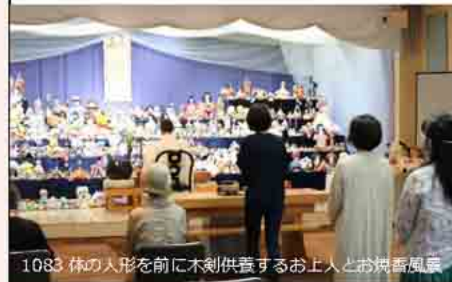
1083体の人形を前に木剣供養するお上人とお焼香風景

5/30(金) 11~12時 ●場所 こすもす齋場 (八王子市元横山町 2-14-19) ●御導師 日蓮宗法華寺 お上人