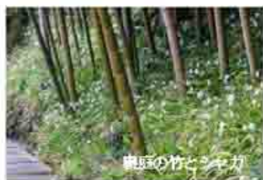
庭園の竹とシメガ

さて戻って来て長寿寺の山門をくぐってみると正面が本堂、右手には庭園が広がり、その先に見えるのが観音堂である。これがいきなり美しい。しかしまずはお本尊様に挨拶が先なので、本堂に上げて頂き参拝する。本堂とつながる書院には、窓際に座布団など用意されているので、そこでゆつくりと庭を眺めることが出来る。観音堂がある表の庭をよく眺めると、蛙がいる。とりあえず趣がある。裏庭は枯山水になっていて、苔と白砂が美しい。本堂を出てぐるっと裏庭まで歩いていくと、春であれば竹林一面のシャガに出会えるだろう。